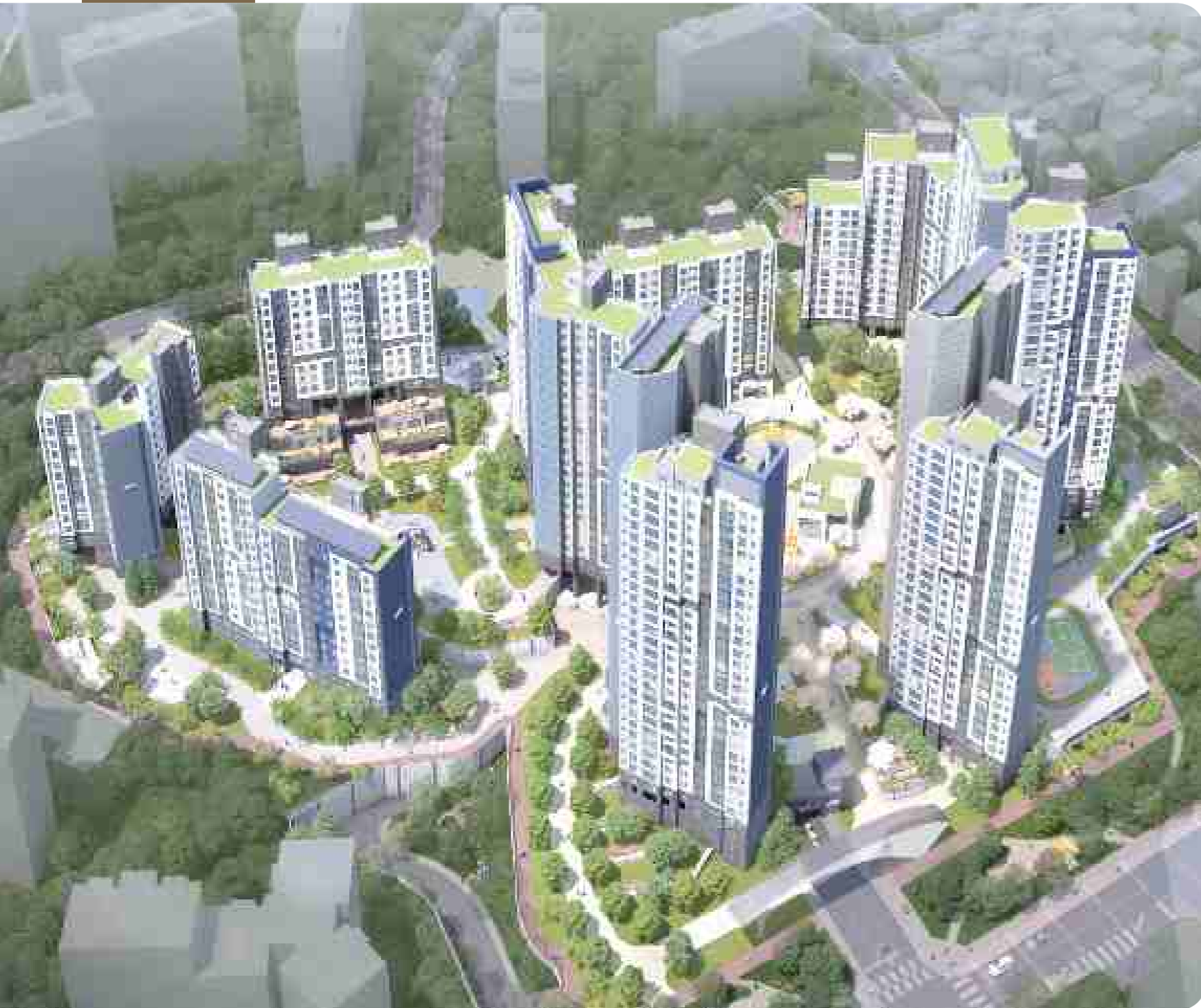
상기 단지조감도는 입주자의 이해를 돕기 위해 제작된 개략도이므로 개발계획 및 사업계획, 설계변경 등으로 인해 조정 될 수 있습니다.